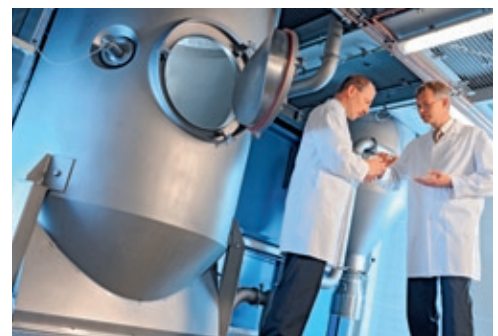
Determinadas combinaciones de emulsionantes logran características funcionales totalmente nuevas gracias al secado por pulverización común