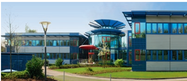
El centro de tecnología en Ahrensburg, cerca de Hamburgo