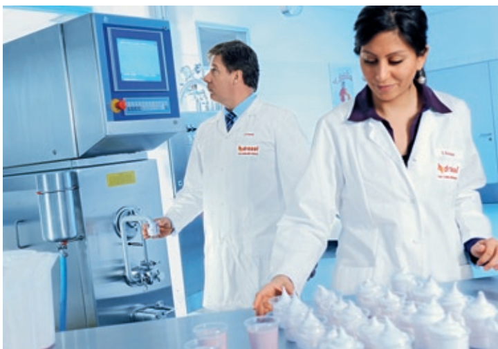
Unidad piloto de helados en el instituto técnico de helados