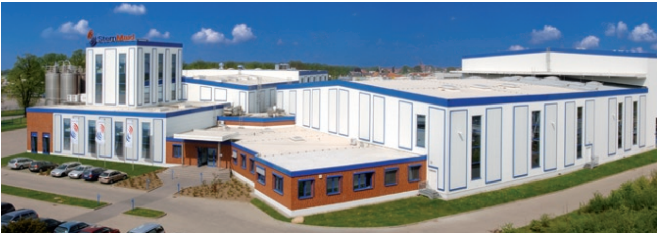
Planta de producción de Hydrosol en Wittenburg, cerca de Hamburgo