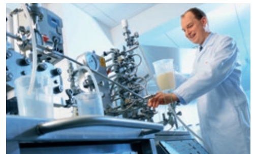
Pasteurización y homogeneización en el Instituto técnico de helados

Por su tamaño y equipo, el moderno centro de tecnología del Stern-Wywiol Gruppe es único en una empresa independiente. En él está concentrada la investigación de aplicación del grupo de empresas en 10 laboratorios. En un total de 2.000 m 2 y formando equipos interdisciplinarios, nuestros ingenieros de desarrollo trabajan en nuevos compuestos de sustancias activas para la industria alimenticia.