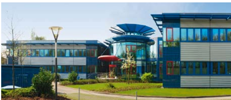
Le centre technologique d'Ahrensburg, près de Hambourg