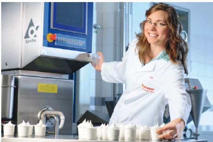
Congélateur, espace technique dédié aux glaces