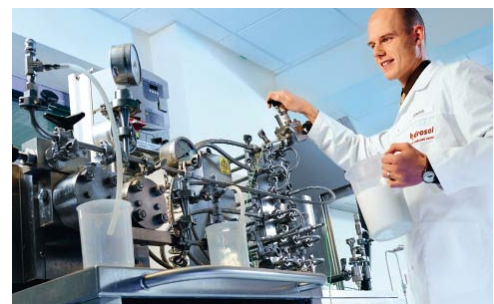
Pasteurisation et homogénéisation, espace technique Glaces

Le centre technologique ultra-moderne du Stern-Wywiol Gruppe a une taille et un équipement exceptionnels pour une entreprise indépendante des grands groupes industriels. Une superficie de 2 000 m 2 y est réservée à la recherche appliquée. C'est là que nos ingénieurs de développement travaillent en équipes interdisciplinaires à la mise au point de nouveaux mélanges d'actifs destinés au secteur agroalimentaire.