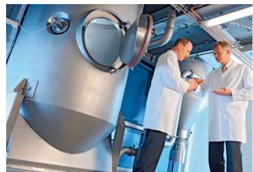
Certaines combinaisons d'émulsifiants acquièrent de toutes nouvelles propriétés fonctionnelles lorsqu'elles sont séchées ensemble par atomisation.