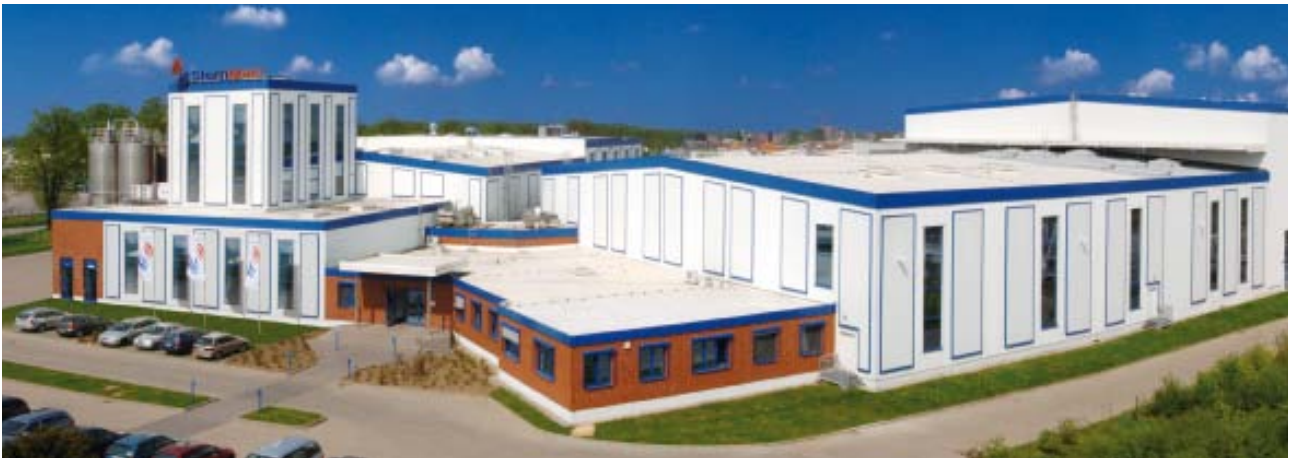
Le site de production d'Hydosol à Wittenburg, près de Hambourg